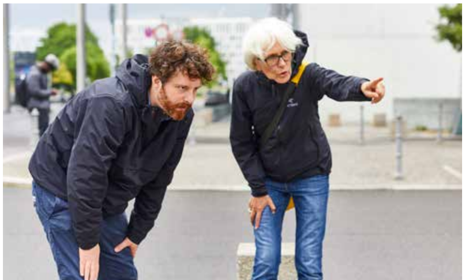
Dreharbeiten in Berlin